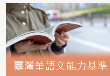
臺灣華語文能力基準